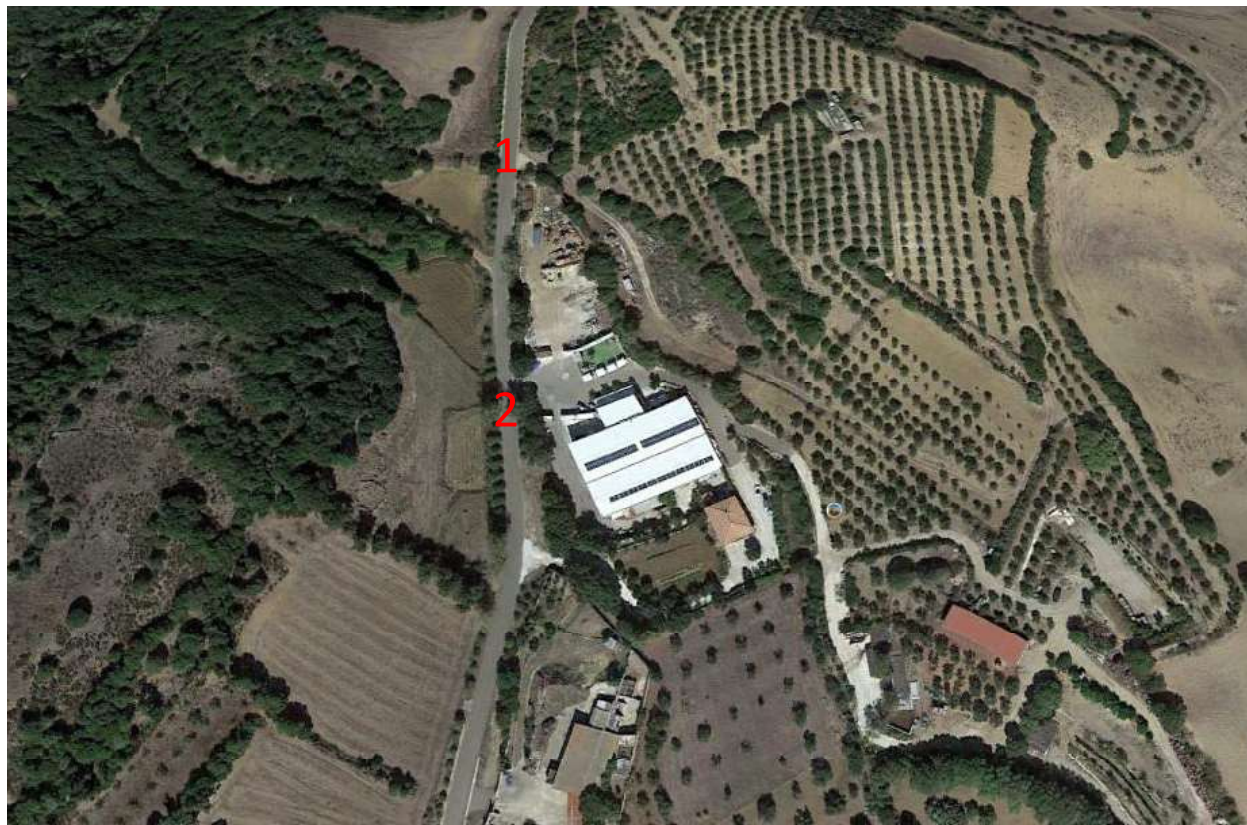
Punti di campionamento